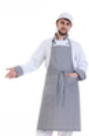
Фартук поварской из профессиональной ткани