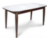
Стол Турин Орех

Орех темный/стекло «Белый глянец». Стол «Турин» раздвижной,стекло. Увеличивается на 450 мм. Подстолье и ножки массив бука. Столешница и вставки: ЛДСП Белое матовое стекло выгодно контрастирует с ножками и подстольем цвета «Орех темный». Это сочетание придает столу строгость и в то же время изысканность. Столешница из термозакаленного стекла. Такое стекло обладает повышенной механической прочностью и безопасностью. Его трудно разбить, но даже в этом случае осколки не смогут причинить вред - стекло распадается на мелкие кусочки с тупыми гранями.Класс эмиссии ЛДСП - E1 признан государственным Стандартом безопасным для применения в мебели, в т.ч. детской. ДСП облицована стойкой меламиновой пленкой, а срезы плиты герметизированы кромкой.Материал, используемый при изготовлении подстолья и ножек стола - массив бука - исключительно прочный и долговечный натуральный материал. Бук надежно удерживает фурнитуру, поэтому стол прослужит долго! В случае ослабления элементов, достаточно подтянуть их в домашних условиях.Термозакаленное стекло не боится контактов с горячими предметами, однако, необработанные края посуды могут поцарапать ее. Не рекомендуется резать на столешнице и использовать абразивные вещества. Сборно-разборное изделие, упаковывается в 2 пакета. 1) 1155x435x85 мм., 2) 875x795x125 мм. Общий объем: 0,12 м3, масса: 54 кг. Допустимая нагрузка на стол - 80 кг.