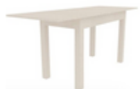
Стол раздвижной Сити