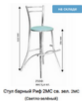
Стул барный Риф 2МС