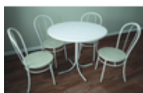
Стол обеденный 50