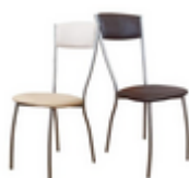
Стул с мягкой спинкой сильвия м

Данные стулья возможно заказать в двух цветах.