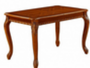
СТОЛ ОБЕДЕННЫЙ КЛАССИЧЕСКИЙ ТРАНСФОРМЕР 826 (МИЛАНСКИЙ ОРЕХ)

Материал корпуса: массив Материал столешницы: МДФ, шпон Цвет корпуса: белый антик Цвет столешницы: белый антик Стиль: Переходный Глубина: 100 Ширина: 160 Высота: 75 Вес (кг): 52.5 Фабрика: Avanti Страна производитель: Малайзия