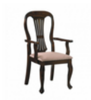
СТУЛ ДЕРЕВЯННЫЙ VERA (ТЕМНЫЙ ОРЕХ) С ПОДЛОКОТНИКАМИ

Материал корпуса: массив (гевея) Материал обивки: ткань Цвет корпуса: темный орех Цвет обивки: бежевый Глубина: 54 Ширина: 63 Высота: 106 Вес (кг): 7.6 Фабрика: Avanti Страна производитель: Малайзия