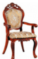
СТУЛ КЛАССИЧЕСКИЙ 8072 АС (ИТАЛЬЯНСКИЙ ОРЕХ) С ПОДЛОКОТНИКАМИ

Материал корпуса: массив Материал столешницы: МДФ, шпон Цвет корпуса: миланский орех Цвет столешницы: миланский орех Глубина: 80 Ширина: 120 Высота: 76 Вес (кг): 43 Фабрика: Avanti Страна производитель: Китай