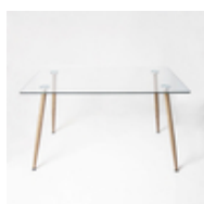
Стол стеклянный Торонис

Стол стеклянный Торонис – идеальное интерьерное решение для гостиной, столовой или кухни. Приверженцы минимализма оценят проявления любимого стиля: отсутствие навязчивого декора, легкость и «воздушность» стола делают его аутентичным.