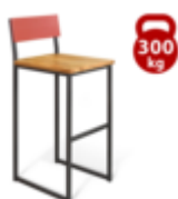
Стул барный SHT-S91

Материалы и высокий уровень исполнения говорят о прочности и долговечности стула. Сидение и спинка выполнены из массива дуба. Естественный рисунок и текстура дерева подчеркнута покрытием из прозрачного лака. Спинка, окрашенная в приятный цвет лосось RAL3022, добавит изюминку в любое цветовое решение интерьера. Барный стул SHT-S91 отлично впишется в лофт пространство. Эффектно будет смотреться в интерьере паба, бара, кафе. Уникальность стула SHT-S91 составляют несколько отличительных черт:- На сидение нанесено специальное углубление для большего тактильного комфорта- Тыльная сторона оригинального сидения имеет фрезеровку, что значительно облегчает конструкцию- Между деревянным сидением и каркасом проложен герметик, что позволяет избежать скрипов и повышает надежность крепления - Каркас стула выполнен из металлической трубы, длиной/шириной 20 мм. и окрашен порошковой краской, устойчивой к механическому воздействию;- Используйте стул в помещении или на закрытой веранде;- Максимальная статическая нагрузка на стул 300 кг.