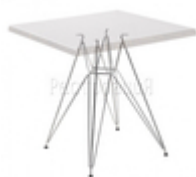
Подстолье Eames, хром

Производство Китай Артикул 940408 Каркас Металл, порошковое покрытие Диаметр, см 43 Высота, см 72 Вес, кг 18,7 Цвет Черный; Покраска под RAL Рекомендованные размеры столешниц, мм 800*800 Ø900