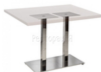
Подстолье Harvey Square Double Inox LU/Inox

Артикул 860420 Каркас Хромированная сталь Ширина, см 50 Глубина, см 50 Высота, см 71 Рекомендованные размеры столешниц, см 80x80, Ø90