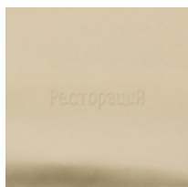
Напероны PROFY LINE

При сервировке стола одним из важнейших моментов является выбор скатерти. Светлые скатерти подходят практически к любому случаю. Цветными скатертями украшают «шведские» столы, клетчатые хороши для чайных столов. Специалисты по сервировке столов советуют выбирать скатерть, что бы она свисала на 15-30см. На длинный стол кладут две скатерти, таким образом, что бы стык не был виден со стороны входа в помещение. Красивая скатерть на столе – признак вкуса, изысканности и уюта.