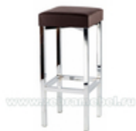
Табурет барный Куб