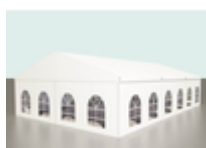
Шатер двускатный 10x15

Двускатный шатер легко устанавливается на любой поверхности (грунте, газоне, асфальте, бетонных площадках и т. д.) без подъемных механизмов. Для сборки конструкции и ее монтажа хватит 4 человека. Это идеальный вариант для open-air мероприятий любых масштабов. Вы можете провести корпоратив, фестиваль, выставку, ярмарку и пр., точно зная, что у гостей будет укрытие в любую погоду.