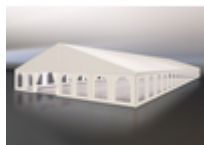
Шатер двускатный 20x50

Компания «Фабрика Шатров» предлагает взять в аренду или приобрести тентовую конструкцию с параметрами 20x50 м по доступной цене. Такой огромный шатер подойдет для организации таких крупных мероприятий как свадебное торжество или юбилей. Он отличается прекрасными характеристиками: Стандартная двускатная крыша гарантировано впишется в любой ландшафтный дизайн и будет выгодно его дополнять. Сама конструкция белая, но ее можно украсить, нанеся изображения, надписи или прикрепив цветы и шаррики.