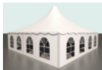
Шатер Пагода 10x10

Продаем и сдаем в аренду шатровые конструкции типа «Пагода» собственного производства со сторонами 10 на 10 метров. Такие шатры обладают большой вместительностью. Площади 100 квадратных метров хватит для всей необходимой мебели, торгового или выставочного оборудования. Конструкция — идеальное решение для проведения массовых мероприятий на открытых пространствах, в крытых неотапливаемых посещениях с высотой потолка более 4,5 метров. Характеристики уточняйте у производителя