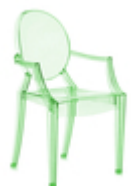
Стул детский Lou Lou Ghost

На волне неудержимой популярности Louis Ghost родилась бейби-версия прославленного творения Старка. Lou Lou Ghost, унаследовавший классические линии, материал, прочность и эргономичность своего предшественника, учит самых маленьких с самого начала пользоваться «взрослым» стулом, пусть и небольшим по размеру. Предназначенный для детской аудитории, стул представлен в широкой гамме самых радостных и сочных оттенков.