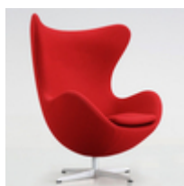
Дизайнерское кресло Egg chair (Arne Jacobsen Style) A219 red

Дизайнерское кресло Egg chair прекрасно впишется в любой интерьер.