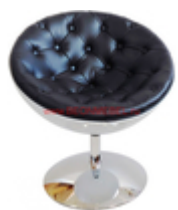
Дизайнерское кресло Lotus Lux с пуговицами (черное) A606

Как известно уныние и депрессию можно лечить не только медицинским путем, но и шопингом. Это эффективнее, быстрее и приятнее. Причем не обязательно поднять настроение позволит приобретение нового элемента гардероба или модный аксессуар.