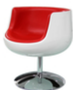
Барное кресло Cup Cognac A340-1

Сочетание оттенков красного цвета и белого – всегда беспроигрышный дизайнерский ход. Это лишний раз подтверждает такое эффектное изделие, как барное кресло Cognac Eero Saarinen A340-1.