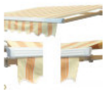
Маркиза открытая А-1050

Маркиза АЛЕКО А-1050 сворачивается и разворачивается при помощи рукоятки (входит в комплект), без использования электричества. Опционально устанавливается моторизированное управление, а так же датчик ветра и освещенности. Моторизированное управление рекомендуется для больших размеров. Данная модель открытого типа, имеет мощные рычаги и каркас, идеально подходит для средних и больших размеров. Рекомендуется устанавливать в местах защищенных от внешних воздействий: под вылетом крыши, в нише здания. Можно регулировать вынос полотна до 3,5 метров, и наклон полотна в пределах от 5 до 60 градусов. Рассчитана на повышенные ветровые нагрузки. Алюминиевый барабан имеет диаметр 68/78 мм. Основание выполнено из стального профиля 40x40 мм. В комплекте 3 или 4 (в зависимости от ширины) крепежных кронштейна с анкерными болтами для установки на бетонное основание. ширина 4.0 м, вынос полотна до 3.5 м, ширина 5.0 м, вынос полотна до 3.5 м, ширина 6.0 м, вынос полотна до 3.5 м