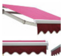
Маркиза открытая А-1000

Маркиза АЛЕКО А-1000 сворачивается и разворачивается при помощи рукоятки (входит в комплект), без использования электричества. Опционально устанавливается моторизированное управление, а так же датчик ветра и освещенности. Моторизированное управление рекомендуется для больших размеров. Данная модель открытого типа, имеет мощные рычаги и каркас, идеально подходит для средних и больших размеров. Рекомендуется устанавливать в местах защищенных от внешних воздействий: под вылетом крыши, в нише здания. Можно регулировать вынос полотна до 3-х метров, и наклон полотна в пределах от 5 до 60 градусов. Рассчитана на повышенные ветровые нагрузки. Алюминиевый барабан имеет диаметр 68/78 мм. Основание выполнено из стального профиля 40x40 мм. На маркизе шириной 6 метров, по центру установлен поддерживающий ролик, который исключает провисание барабана с тканью. Для большей плавности хода отрегулируйте положение ролика так, чтобы он опирался на шов ткани. В комплекте 2 (3 или 4 в зависимости от ширины) крепежных кронштейна с анкерными болтами для установки на бетонное основание. ширина 3.0 м, вынос полотна до 2.5 м, ширина 4.0 м, вынос полотна до 3.0 м, ширина 6.0 м, вынос полотна до 3.0 м