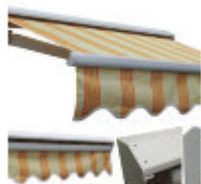
Маркиза полукассетная А-6100

Маркиза АЛЕКО А-6100 сворачивается и разворачивается при помощи рукоятки (входит в комплект), без использования электричества. Эта полукассетная маркиза имеет алюминиевый козырёк для защиты ткани и каркаса от дождя и солнца. Простая модель с легкими рычагами и каркасом, идеальна для небольших размеров. Можно регулировать вынос полотна до 3-х метров, и наклон полотна в пределах от 5 до 60 градусов. Рассчитана на высокие ветровые нагрузки. Алюминиевый барабан имеет диаметр 58/68 мм. Основание выполнено из стального профиля 35x35 мм. Размер козырька 190x1,8 мм. В комплекте 2 крепежных кронштейна, с анкерными болтами для установки на бетонное основание. Возможна установка электропривода с пультом ДУ, а так же датчика ветра и освещенности. ширина 2.0 м, вынос полотна до 1.5 м., ширина 2.5 м, вынос полотна до 2.0 м, ширина 3.0 м, вынос полотна до 2.5 м