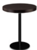
Стол со столешницей LighTop круглый

Круглые столы, базовое покрытие порошковая эмаль - стандартный цвет каркаса черный - основание стола d=450мм - столешница от d=600мм - высота стола h=770мм - разборный - столешницы LighTop размеры и цвета в ассортименте.