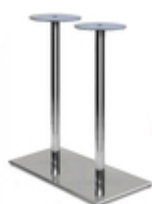
Подстолье Прямоугольник Бар №9

Подстолье производство Германия, сборное Модель "Web B 51" хром Размеры 460x460x720мм Труба d=60мм Вес 10 кг. Подстолье хромированное «B 51» - разборная конструкция производства Германия, стилизованная под 2850 барочный стиль. Четыре луча, составляющие главную опору, надежно удерживают столешницу, не давая ей качаться. Подстолье подходит для стеклянных столов и для столешниц Werzalit, Duolit, ДСП, МДФ. Его можно купить оптом и в розницу через наш магазин в СПб.