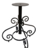
Подстолье кованое Розалия

Кованое подстолье Розалия Сварная конструкция Высота 730мм, с учетом регулируемых винтовых опор Максимальная ширина 745мм (по завиткам) Верхняя площадка с отверстиями под саморезы 280мм Возможна комплектация пятаком под УФ-склейку (для столешниц из стекла) Цвет покрытия черный эмаль. Кованое подстолье Розалия - фантазийное подстолье для стола. Причудливый узор напоминает перевернутый цветок розы. Подстолье устойчивое, сварное из цельнометаллического прутка. Верхняя площадка 4200 сталь 4мм с отверстиями под саморезы, разборная. Возможна комплектация пятаком под УФ-склейку для столешниц из стекла. Подстолье укомплектовано регулируемыми винтовыми опорами, что позволяет ровно выставить конструкцию. Предназначено для столешниц: D800, D900, 800/800, 900/900 мм. Сроки изготовления 2 недели. Возможно изменение высоты подстолья. Покрытие эмаль, цвет черный. От 5 шт возможно покрытие шагрень, цветная эмаль, бриллиант (доп.цена). На складе в черном цвете.