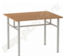
Стол обеденный на разборном металлическом каркасе