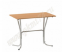
Стол обеденный "Вега 2" разборный