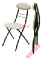
Стул Луна (складной)

Для производства металлокаркаса мы используем высококачественную стальную мебельную трубу различных профилей и диаметров. Сиденье и мягкая вставка – односторонние, беспружинные, изготовлены из пенополиуретана эластичного на основании из древесноволокнистой плиты МДФ. Сиденье, мягкая вставка и декоративная панель облицованы кожзаменителем.