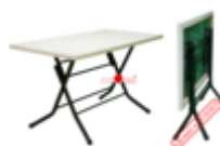
Стол Т-161 (складной)

Каркас стола Т 161 имеет складную рамную конструкцию. Это позволяет иметь компактный размер упаковки (что очень важно при транспортировке), а так же обеспечивает прочность готового, собранного изделия. Основным материалом в производстве столешниц является качественные плиты МДФ, с 2-х (!) сторонней облицовкой (прессованием) декоративным бумажно-слоистым пластиком (ДБСП). Кстати, именно за счет использования ДБСП, наши столешницы обладают хорошей термо- и износостойкостью. Кромка столешниц может быть 2-х видов, плоская торцовая с лентой ПВХ, либо «фасонная», выполненная фрезой с последующей окраской в тон применяемого пластика. В обоих случаях торцы столешниц имеют утолщения по периметру (+ слой МДФ), что придает более эстетический вид столу. Обращаем ваше внимание, мебель нашего производства предназначена для эксплуатации в закрытых помещениях!!! Формы и размеры столешниц (в метрах): ПРЯМОУГОЛЬНЫЕ: 1,20 x 0,68; 1,28 x 0,80