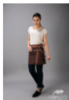
Фартук для официанта

Фартук с двойным накладным карманом. Пояс и внутренний карман из отделочной ткани. Длина 40см., Ширина 100см. Состав: 35% х/б – 65% п/э Плотность: 102 г/м 2 , 210 г/м 2 Фартук с притачным поясом контрастного цвета. Большой накладной карман посередине фартука разделен отделочной строчкой на два отсека, внутренний карман так же двойной. Благодаря уникальному крою надежно держит форму и не мнется. Длинные завязки обеспечивают регулируемую ширину обхвата. Дополнительные закрепки в углах карманов и на поясе делают его износостойким и надежным. Возможно нанесение вышивки. Ткани, которые мы используем для производства фартуков, имеют наиболее оптимальное соотношение волокон – 65% полиэстера и 35% хлопка. Высокая доля ПЭ придает ткани повышенные физико-механические характеристики, а наличие хлопка – отличные гигиенические качества. Благодаря своему составу, ткани износостойчивые, служат долго и не требуют специального ухода. При этом сохраняются комфорт, мягкость и воздухопроницаемость хлопка.