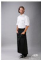
Фартук длинный, черный

Фартук поварской со шлицей Два накладных кармана по бокам. Длина 90 см., ширина 100 см. Состав: 35% х/б – 65% п/э Плотность: 190 г/м 2 Дизайнерская модель поварского фартука со шлицей. Длинные завязки регулируют ширину обхвата. Дополнительные закрепки в углах карманов и на поясе делают его износостойким и надежным. Дополнен удобным накладными карманами. Возможно нанесение вышивки.