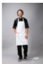
Фартук с грудкой, белый