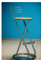
Барный стул Зета-Бистро

Барные стулья стали вполне привычным явлением. Эти стулья — обитатели баров, кафе и ресторанов, отвоевывают себе все больше пространства в нашей жизни. Они уверенно вошли в офисный мир: нередко их увидишь рядом со стойкой ресепшн, которая по сути своей очень похожа на ту, за которой сидят посетители питейных заведений. Барный стул стал атрибутом домашней мебели в современных интерьерах, их часто используют как на кухне, так и в гостиной. Это отличный вариант для квартиры-студии, где кухня является продолжением жилого пространства.