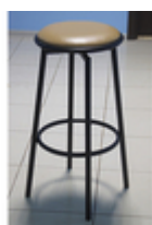
Барный стул Бистро

Барные стулья стали вполне привычным явлением. Эти стулья — обитатели баров, кафе и ресторанов, отвоевывают себе все больше пространства в нашей жизни. Они уверенно вошли в офисный мир: нередко их увидишь рядом со стойкой ресепшн, которая по сути своей очень похожа на ту, за которой сидят посетители питейных заведений. Барный стул стал атрибутом домашней мебели в современных интерьерах, их часто используют как на кухне, так и в гостиной. Это отличный вариант для квартиры-студии, где кухня является продолжением жилого пространства.