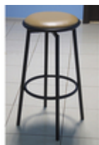
Барный стул Бистро

Барные стулья стали вполне привычным явлением. Эти стулья — обитатели баров, кафе и ресторанов, отвоевывают себе все больше пространства в нашей жизни. Они уверенно вошли в офисный мир: нередко их увидишь рядом со стойкой ресепшн, которая по сути своей очень похожа на ту, за которой сидят посетители питейных заведений. Барный стул стал атрибутом домашней мебели в современных интерьерах, их часто используют как на кухне, так и в гостиной. Это отличный вариант для квартиры-студии, где кухня является продолжением жилого пространства. • Каркас табурета изготовлен из стальной трубы диаметром 20,25 мм и толщиной стенки 1,2мм. Покрашен полимерно порошковой краской. • стандартные цвета: серебро, белый, черный • сиденье стула выполнено из фанеры толщиной не менее 9мм, поролон 20мм и кожзам устойчивый к многократным воздействиям. • Высота 1050 мм, высота от пола до сидения 750 мм, диаметр сидения 340 мм • максимальная нагрузка 140кг • вес стула 5 кг