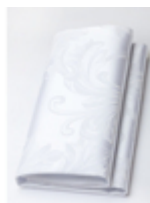
Салфетка Barocco Scandinavia/белый

Салфетка для ресторана Ткань Артикул Barocco Цвет Scandinavia/белый Состав Хлопок 50% Полиэстер 50% Плотность 225 г/м2 Усадка по основе 3% Усадка по утку 1,5% Переплетение Жаккард Производитель Италия Стирка при max t 90 градусов При отбеливании не использовать хлор Сушка в машине запрещена Чистка с обычными реагентами Глажка при max t 150 градусов Гладить влажным!!! 222