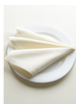
Салфетка Satin 180V Avorio/шампанское

Ткань: Артикул Satin 180V Цвет: Avorio/шампанское Состав: Хлопок 100% Плотность: 205 г/м 2 Усадка по основе: 7% Усадка по утку: 4% Переплетение: Сатин Производитель ткани: Италия Стирка при max t 90 градусов При отбеливании не использовать хлор Сушка в машине запрещена Чистка с обычными реагентами Глажка при max t 200 градусов Возможен пошив этого изделия по индивидуальным размерам заказчика.