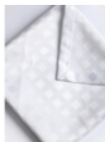
Салфетка Rombo Scandinavia/белый

Салфетка для ресторана Ткань Артикул Barocco Цвет Scandinavia/белый Состав Хлопок 50% Полиэстер 50% Плотность 225 г/м2 Усадка по основе 3% Усадка по утку 1,5% Переплетение Жаккард Производитель Италия Стирка при max t 90 градусов При отбеливании не использовать хлор Сушка в машине запрещена Чистка с обычными реагентами Глажка при max t 150 градусов Гладить влажным!!! 222