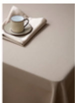
Скатерть Ribes Aprica/бежевый

Ткань Ribes создана специально для ресторанов! Скатерти из ткани Ribes очень долго сохраняют внешний вид без пиллинга и потертостей. Уникальный состав ткани - 65% полиэстер, 30% хлопок, 5% лен. Содержание бельгийского льна придает ткани натуральность и создает структурность, длиноволокнистый египетский хлопок, прошедший специальную термообработку, защищает от пиллинга, а профессиональный полиэстер делает ткань максимально защищенной к истираниям. Дорогостоящая пряжа, высокая плотность жаккардового рисунка, вес - 250 грамм на квадратный метр - все эти качества делают ткань долговечной. Для окраски ткани Ribes использованы уникальные японские красители устойчивые к хлору. Данные красители никогда не применяются при окраске обычных тканей, поэтому эта ткань обладает неоспоримыми преимуществами над другими тканями. Ткань Ribes выдерживает в 6 раз больше стирок чем обычная ткань. Для того, чтобы удалить все пятна, необходима стирка при высокой температуре разрушающей обычные ткани, эксклюзивные технологии позволяют делать ткань Ribes устойчивой к стирке до 90°.