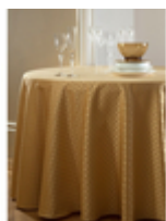
Скатерть банкетная Rombo Firenze/золото

Ткань Артикул Rombo Цвет Firenze/золото Состав Хлопок 50% Полиэстер 50% Плотность 225 г/м2 Усадка по основе до 3% Усадка по утку до 1,5% Переплетение Жаккард Производитель Италия Стирка при max 90 градусов При отбеливании не использовать хлор Сушка в машине запрещена Чистка с обычными реагентами Глажка при max 150 градусов Гладить влажным!!!