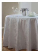
Скатерть банкетная Barosso Scandinavia/белый

Ткань Артикул Barosso Цвет Scandinavia/белый Состав Хлопок 50% Полиэстер 50% Плотность 225 г/м2 Усадка по основе 3% Усадка по утку 1,5% Переплетение Жаккард Производитель Италия Стирка при max t 90 градусов При отбеливании не использовать хлор Сушка в машине запрещена Чистка с обычными реагентами Глажка при max t 150 градусов Гладить влажным!!!