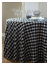
Скатерть банкетная Check-Point

Ткань Артикул Check-Point Цвет Black/черный Состав Полиэстер 100% Плотность 203 г/м2 Усадка по основе 1% Усадка по утку 0,5% Переплетение Саржа Производитель США 2200 Стирка при max t 70 градусов При отбеливании не использовать хлор Сушка в машине запрещена Чистка с обычными реагентами Глажка при max t 150 градусов Гладить влажным!!!