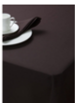
Наперон Oxford Chocolate/шоколад

Ткань Oxford - это инновационный полиэстер, и в отличие от обычного, бытового полиэстера, отлично впитывает жидкость. На ощупь изделия из этого полиэстера напоминают хлопок. Приобретение изделий из такого полиэстера, намного выгоднее, чем из полиэстера обычного. Ткань в процессе длительной эксплуатации отлично сохраняет первоначальный цвет и даже через год изделие выглядит как новое. Изделия из такого полиэстера выдерживают большое количество стирок, сохраняя свой изначальный внешний вид. Стирка при max t 70 градусов обеспечивает полное отстирывание пятен, при этом качества ткани сохраняются. Ткань становится мягкой после первой стирки.