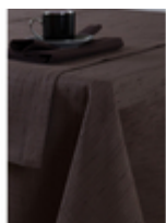
Скатерть Rustic Тауре/шоколад

Ткань Артикул Rustic Цвет Тауре Состав Полиэстер 100% Плотность 210 г/м2 Усадка по основе 1% Усадка по утку 0,5% Переплетение Структура Производитель ткани США Стирка при max t 70 градусов При отбеливании не использовать хлор Сушка в машине запрещена Чистка с обычными реагентами Глажка при max t 170 градусов 1306