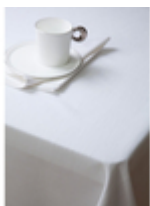
Скатерть Ribes Scandinavia/белый

Ткань Ribes создана специально для ресторанов! Скатерти из ткани Ribes очень долго сохраняют внешний вид без пиллинга и потертостей. Уникальный состав ткани - 65% полиэстер, 30% хлопок, 5% лен. Содержание бельгийского льна придает ткани натуральность и создает структурность, длиноволокнистый египетский хлопок, прошедший специальную термообработку, защищает от пиллинга, а профессиональный полиэстер делает ткань максимально защищенной к истираниям. Дорогостоящая пряжа, высокая плотность жаккардового рисунка, вес - 250 грамм на квадратный метр - все эти качества делают ткань Ribes долговечной. Для окраски ткани Ribes использованы уникальные японские красители устойчивые к хлору. Данные красители никогда не применяются при окраске обычных тканей, поэтому эта ткань обладает неоспоримыми преимуществами над другими тканями. Ткань Ribes выдерживает в 6 раз больше стирок чем обычная ткань. Для того, чтобы удалить все пятна, необходима стирка при высокой температуре разрушающей обычные ткани, эксклюзивные технологии позволяют делать ткань Ribes устойчивой к стирке до 90°.