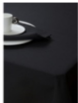
Скатерть Oxford Black/черный

Ткань Oxford - это инновационный полиэстер, и в отличие от обычного, бытового полиэстера, отлично впитывает жидкость. На ощупь изделия из этого полиэстера напоминают хлопок. Приобретение изделий из такого полиэстера, намного выгоднее, чем из полиэстера обычного. Ткань в процессе длительной эксплуатации отлично сохраняет первоначальный цвет и даже через год изделие выглядит как новое. Изделия из такого полиэстера выдерживают большое количество стирок, сохраняя свой изначальный внешний вид. Стирка при max t 70 градусов обеспечивает полное отстирывание пятен, при этом качества ткани сохраняются. Ткань становится мягкой после первой стирки.