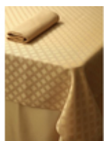
Скатерть Rombo Firenze/золото хлопок 50% полиэстер 50%

Ткань Артикул Rombo Цвет Firenze/золото Состав Хлопок 50% Полиэстер 50% Плотность 225 г/м2 Усадка по основе до 3% Усадка по утку до 1,5% Переплетение Жаккард Производитель Италия Стирка при max 90 градусов При отбеливании не использовать хлор Сушка в машине запрещена Чистка с обычными реагентами Глажка при max 150 градусов Гладить влажным!!!